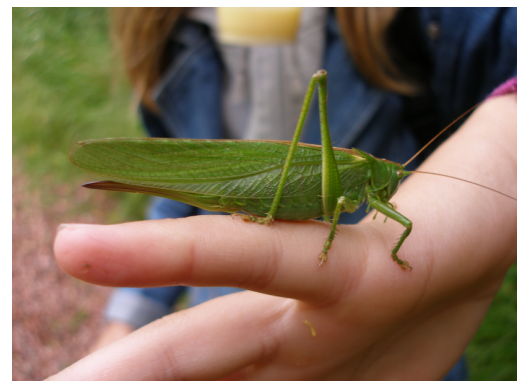
Grote groene sabelsprinkhaan

Koolwants ( Eurydema oleracea ) 15-06-2010