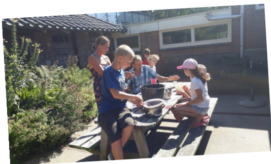
De Struinkids gaan ook gewoon door, warmte of niet. Vorige week persten ze verse sap van de druiven uit de kas.