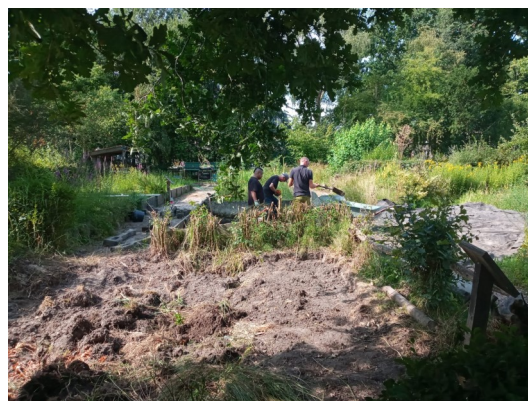
Werk in uitvoering. De vijver in de voorbeeldtuin is gedempt. Het foliedoek gaat naar de zoute bak daarachter, die nu leeg gehaald is. Deze wordt komende weken opnieuw ingericht.